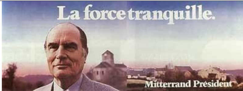
1. Affiche de la campagne présidentielle, 1981.