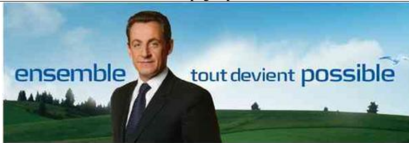
2. affiche de la campagne présidentielle, 2007.