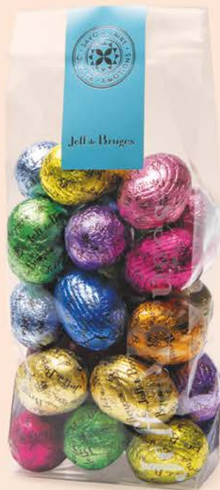
Les Petits oeufs Le sachet de 290 g net d'œufs sous aluminium assortis