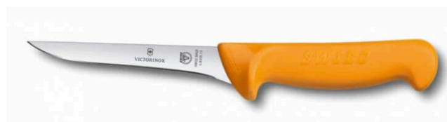
Couteau de boucher: le désosseur

Pour ce dernier jour de stage je suis retourné au laboratoire. Lors de cette matinée, j'ai commencé par l'apprentissage du désossement des morceaux de bœuf. Pour désosser il faut utiliser un autre couteau adapté : le désosseur.