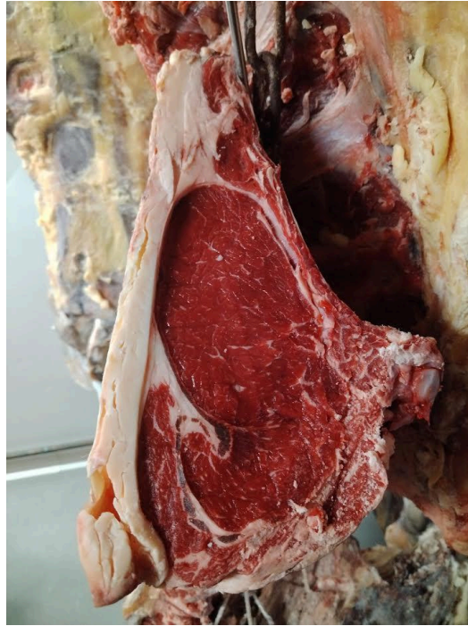
Côte de boeuf une fois prête

Après le désossage j'ai continué à préparer des morceaux de filet pour faire de la viande hachée. Le boucher m'a montré comment découper et préparer une côte de bœuf.