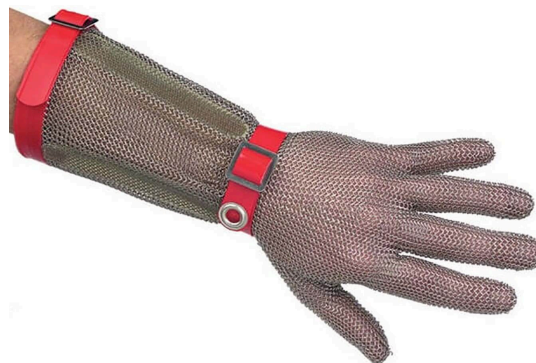
Gant de protection en cote de maille

Pour ma protection, j'ai utilisé gant en maille de fer remontant jusqu'au coude, ce gant permet au couteau de ne pas transpercer la main. J'ai dû mettre des gants en plastique sous et par-dessus la maille de fer afin que cela tienne. J'ai aussi utilisé un tablier en tissu.