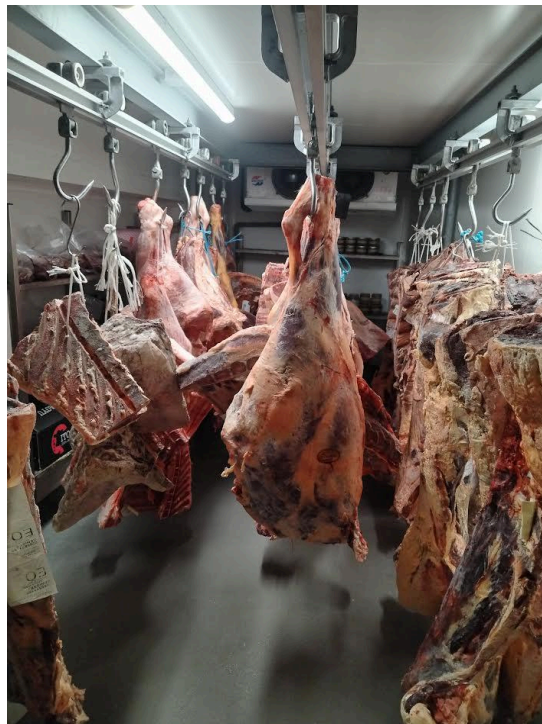
Répartition des quartiers de viande dans le réfrigérateur

J'ai donc commencé par aider à ranger tout ce qui venait d'être livré dans le réfrigérateur. Nous avons reçu des quartiers entiers de boeufs et de veaux.