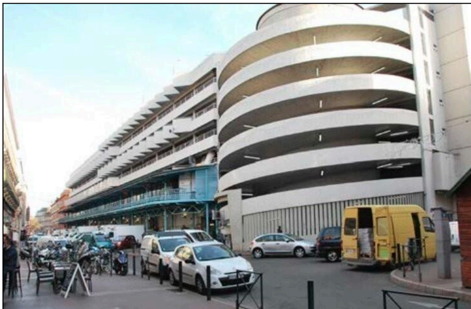
Marché Victor Hugo de Toulouse

J'ai souhaité faire mon stage dans cette boucherie car lors d'achats effectués j'ai pu voir comment les bouchers préparent les viandes, les relations qu'ils peuvent avoir avec certains clients et l'ambiance qui règne dans la loge entre les bouchers.