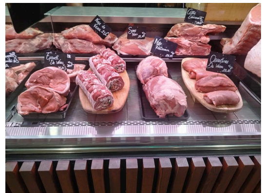
Vitrine de la loge avec les préparations du jour 4